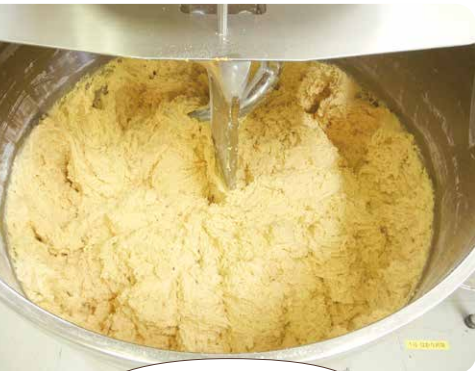
CO・OP香ばし アーモンドの厚焼きせんべい ができるまで

「CO・OP 香ばしアーモンドの厚焼きせんべい」は、 たっぷりのアーモンドが入ってザクザクとした食感と 素材の香ばしさが楽しめるコープクオリティ商品。 南部地方の伝統菓子を洋風アレンジしたおせんべいです。