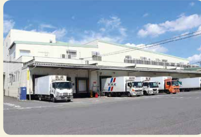
桶川要冷蔵集品センター（埼玉県桶川市）。 冷蔵商品などを集品・分荷し、宅配センターへ配送しています

以前は会員生協それぞれで商品を検査していましたが、コープデリ連合会でその役割をまとめて行うことで、 今までそろえられなかった検査機器をそろえたり、人材確保・育成ができるようになり ました。2018年にはリニューアルし、 見学もできる ようになりました。