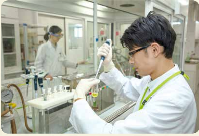
商品検査センターは、フードチェーン全体での食の安全の取り組みが機能していることを、科学的・客観的に確認しています