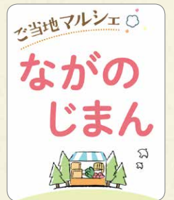
「ご当地マルシェ」ロゴ。各生協ごとに異なります

コープデリ連合会は、今後も会員生協の組合員の皆さまのくらしに貢献できるよう、 事業と活動に取り組みます 。1都7県のコープが手を取りあって、 今までできなかったことも、共同の力で実現 していきます。 設立30周年にあわせて、 今後キャンペーンを行う予定 です。お楽しみに！