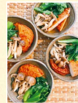
ちよきちよきさん (51歳)

レタスの外葉を「さつま揚げときこのさつと煮」に。火の通りの早い彩り野菜と思ってきれいなところを選んで洗って使います。たまごのスープにもレタスの外葉を仕上げに入れて火が通ると鮮やかな緑に。