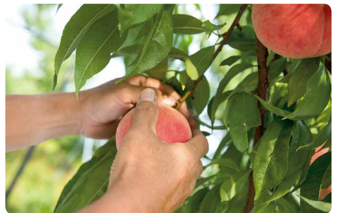
やさしく傷付けないように収穫しています