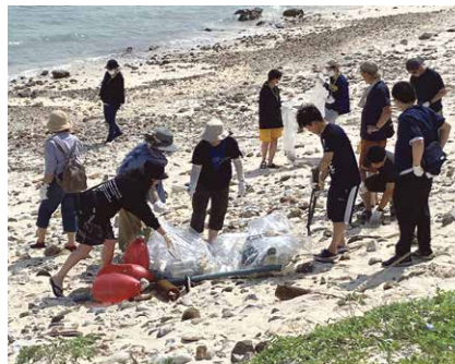
役職員・組合員理事が島を訪問し、海岸清掃に参加しました

に活用されます。おいしいもずくを食べることで、島の美しい自然を守ることができます。