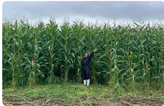
有機牛のエサとなる有機JAS認証取得トモロコシ。総面積11haで、牛の管理と併行して育てている

北十勝ファームで飼育しているのは「日本短角種」という和牛。和牛と言くと黒毛和牛を思い浮かべますが、黒毛和牛はサシと呼ばれる脂が入っていることが価値とされ、輸入穀物中心のエサを与えあまり運動させずに育てます。一方、日本短角種は牧草だけでもよ