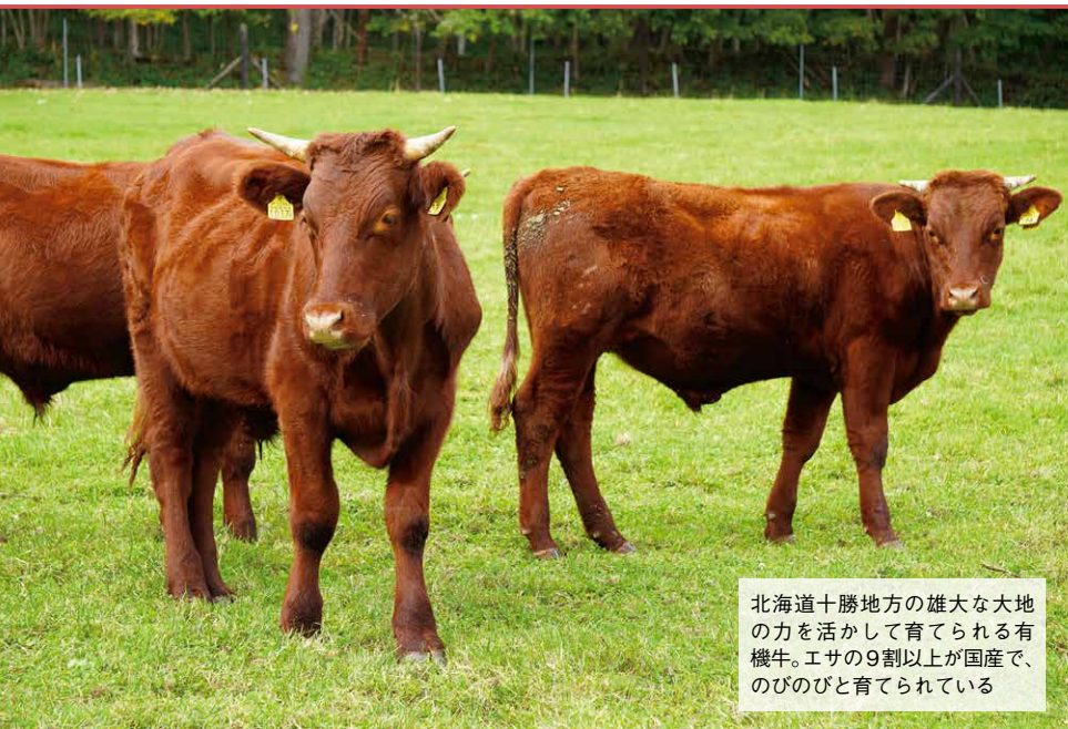
北海道十勝地方の雄大な大地の力を活かして育てられる有機牛。エサの9割以上が国産で、のびのびと育てられている