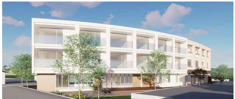
完成予想図(イメージ)