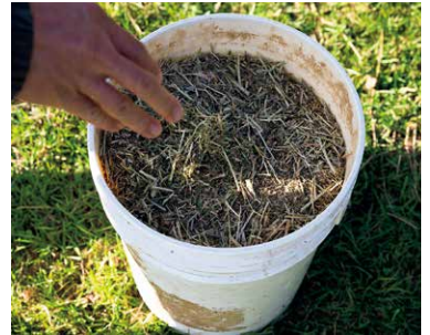
北十勝ファームでは、近隣の耕作放棄地を借り、スタッフが農地を耕してエサとなる作物を育てています