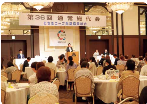
昨年の総代会の様子

「昨年1年間の事業や活動はどうだったのか」を振り返り、「次の1年、どんな事業や取り組みを行うのか」という方針や予算などを決定します。