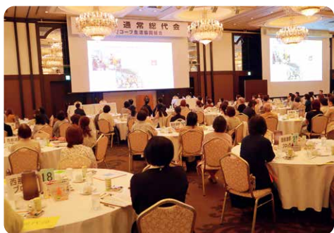
スクリーンに映して議案提案

「わたしの想いを伝えたい…」という用紙で、自分の意見や想いを伝えることもできます。