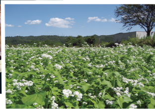
まもなく新そばの時期を迎える。

那須烏山市・那珂川町・茂木町・市貝町 4市町内の30店舗以上が参加！ 実施店舗は、応募用紙またはホームページで確認してください。