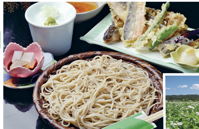
八溝地域のおいしいそばを満喫しよう。

毎年恒例「八溝そば街道スタンプラリー」が今年も開催されます。那須烏山市・那珂川町・茂木町・市貝町の4市町内に30店舗以上あるスタンプラリー参加店で500円以上の買い物をし、異なる3店のスタンプを集めると、抽選で特産品の詰め合わせなどが当たります。応募用紙は参加店または道の駅で配布。参加店はそば店のほか、農産物直売所などもあるので、おいしい八溝そばを味わい土産を買って、スタンプが集まったら奮ってご応募ください。