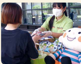
コロナ禍で不安定な生活を送る大学生にも食料品を提供しました

賞味期限がお届け基準以内の商品は、次週以降の企画やインターネット注文「eフレンドズ」での数量限定企画で活用したほか、お店での販売など、できるだけ食品ロスにならないよう努めました。また各地域のフードバンクなど32団体に寄贈しました。